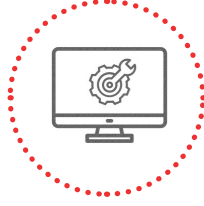
دعم تقنية المعلومات