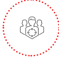
المعارض وإدارة الفعاليات